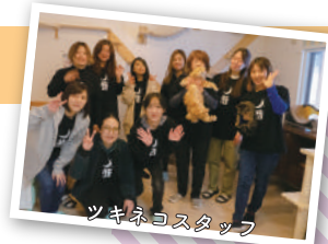
ツキネコスタッフ

支援者の皆様の信頼にお応えできる団体を目指し頑張りますので、今後も当団体の活動を見守っていただければ幸いです。